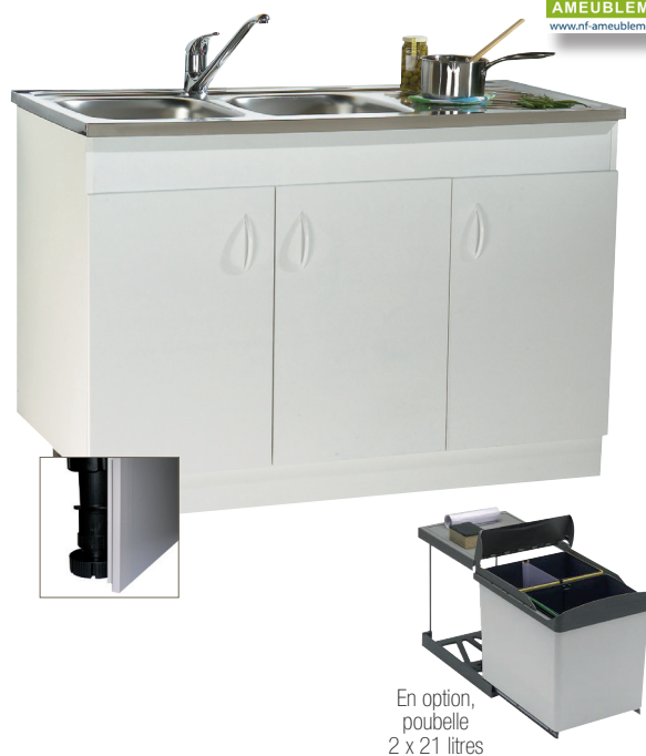
En option, poubelle 2 x 21 litres

Mise à niveau : Pieds ABS réglables avec plinthe clipsable (option) et jeu de retours (option) PPSM* blanc.