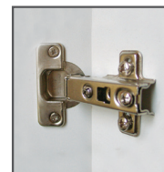
Charnière à rappel automatique