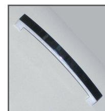
Poignée Métal Chromé Brillant