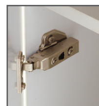
Charnière clipsable avec frein intégré