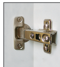
Charnière à rappel automatique