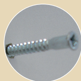
Vis autotourillonnantes 5x50 avec cache blanc