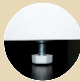
Vérins métalliques réglables